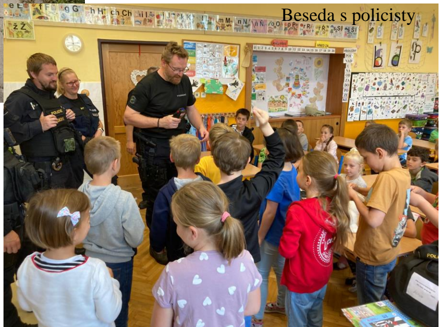
Beseda s policisty