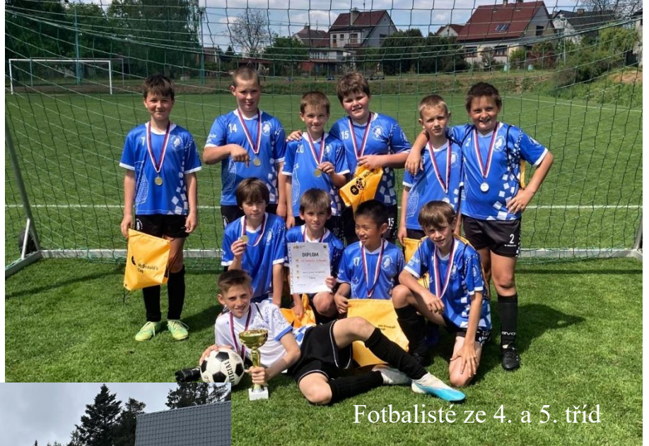
Fotbalisté ze 4. a 5. tříd