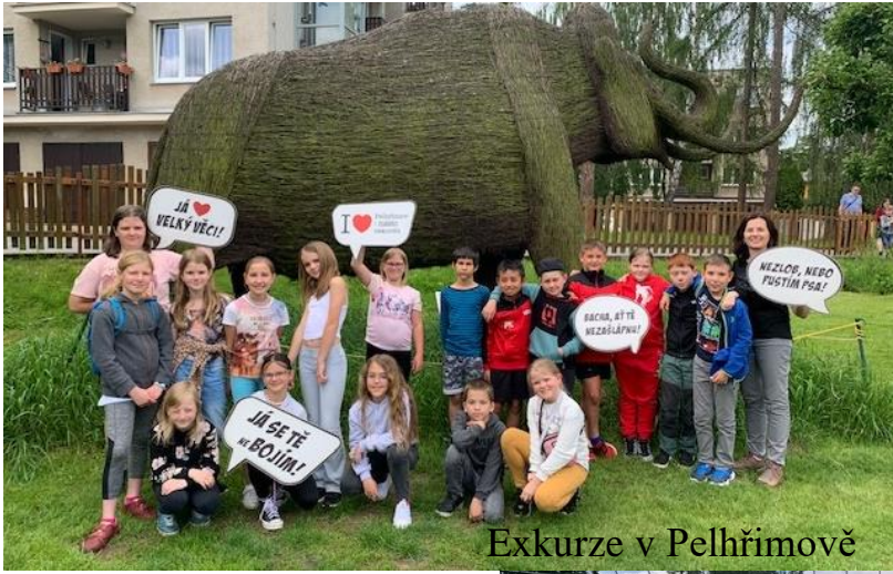
Exkurze v Pelhřimově