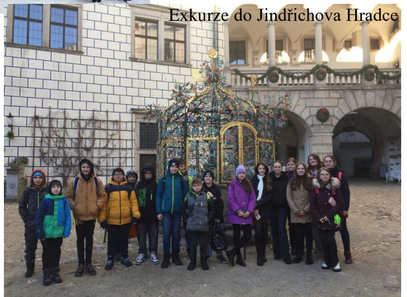
Exkurze do Jindřichova Hradce