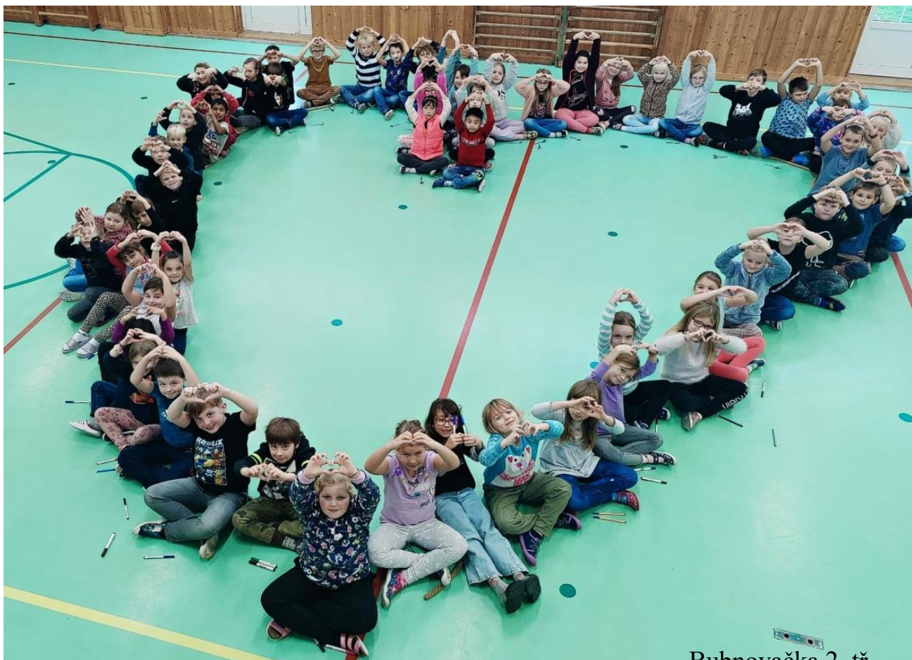
Bubnovačka 2. tř.